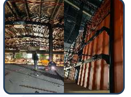
KARACA BASIN EXPRES