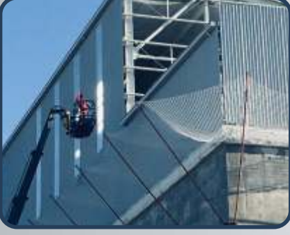
YALIKÖY ŞİŞECAM FABRİKASI