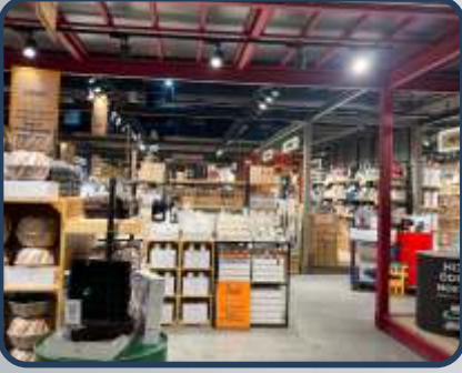
KARACA BASIN EXPRES MAĞAZASI