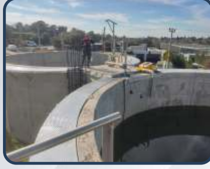
TURGUT REİS ARITMA TESİSİ